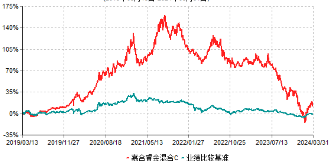
嘉合睿金混合C累计净值增长率与业绩比较基准收益率历史走势对比图 (2019年03月13日-2024年03月31日)