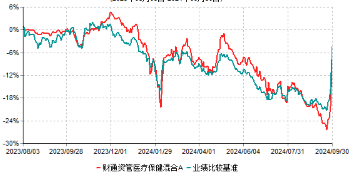
财通资管医疗保健混合A累计净值增长率与业绩比较基准收益率历史走势对比图 (2023年08月03日-2024年09月30日)