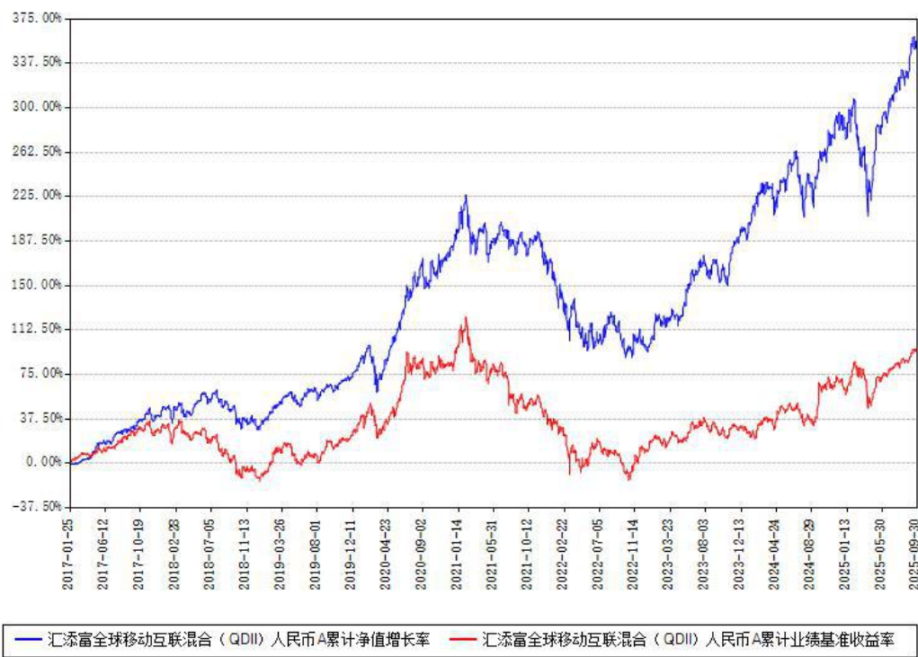
汇添富全球移动互联混合（QDII）人民币A累计净值增长率与同期业绩基准收益率对比图