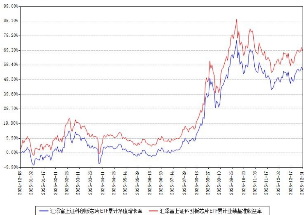
汇添富上证科创板芯片ETF累计净值增长率与同期业绩比较基准收益率对比图

注：本基金建仓期为本《基金合同》生效之日（2024年12月18日）起6个月，建仓期结束时各项资产配置比例符合合同约定。