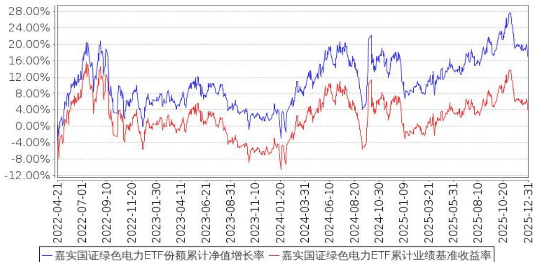
嘉实国证绿色电力ETF份额累计净值增长率与同期业绩比较基准收益率的历史走势对比图 (2022年04月21日至2025年12月31日)

注：按基金合同和招募说明书的约定，本基金自基金合同生效日起6个月为建仓期，建仓期结束时本基金的各项资产配置比例符合基金合同约定。