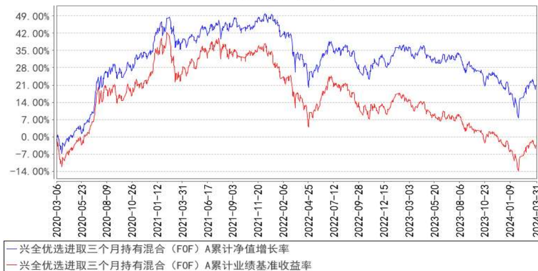
兴全优选进取三个月持有混合（FOF）A累计净值增长率与同期业绩比较基准收益率的历史走势对比图