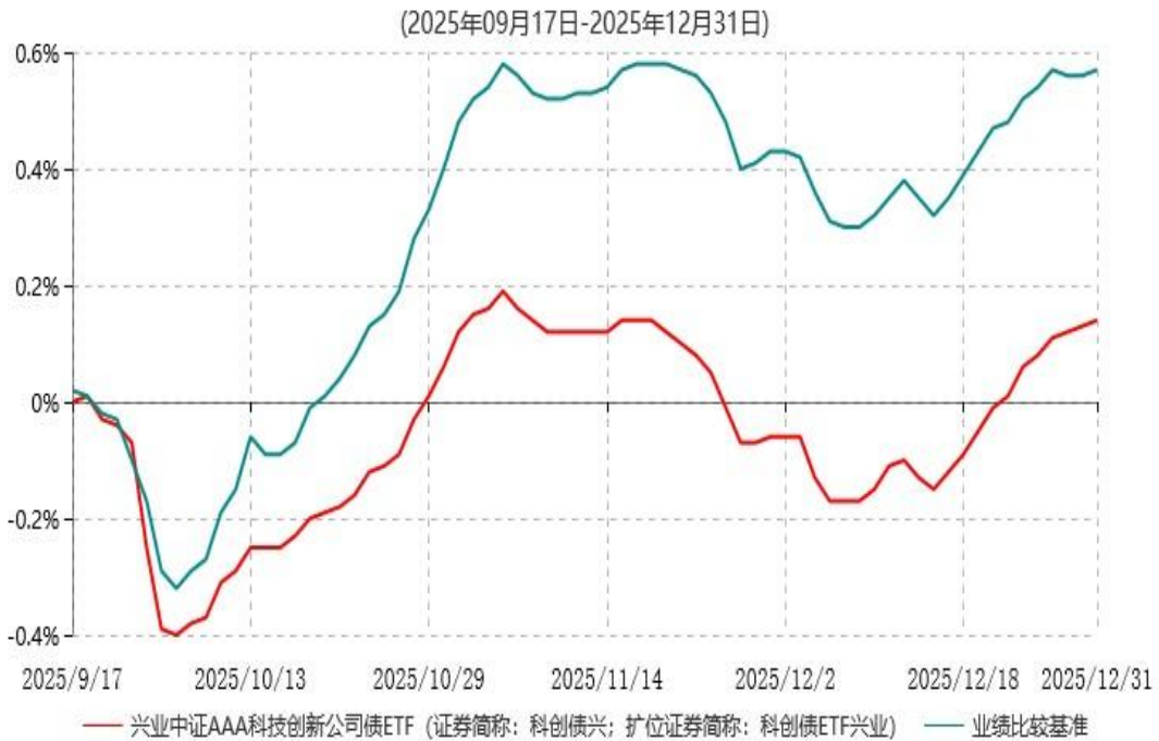
兴业中证AAA科技创新公司债交易型开放式指数证券投资基金累计净值增长率与业绩比较基准收益率历史走势对比图

注：1、本基金基金合同于2025年09月17日生效，截至报告期末本基金基金合同生效未满一年。