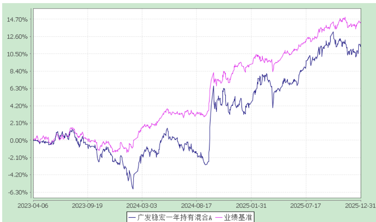
广发稳宏一年持有混合 C