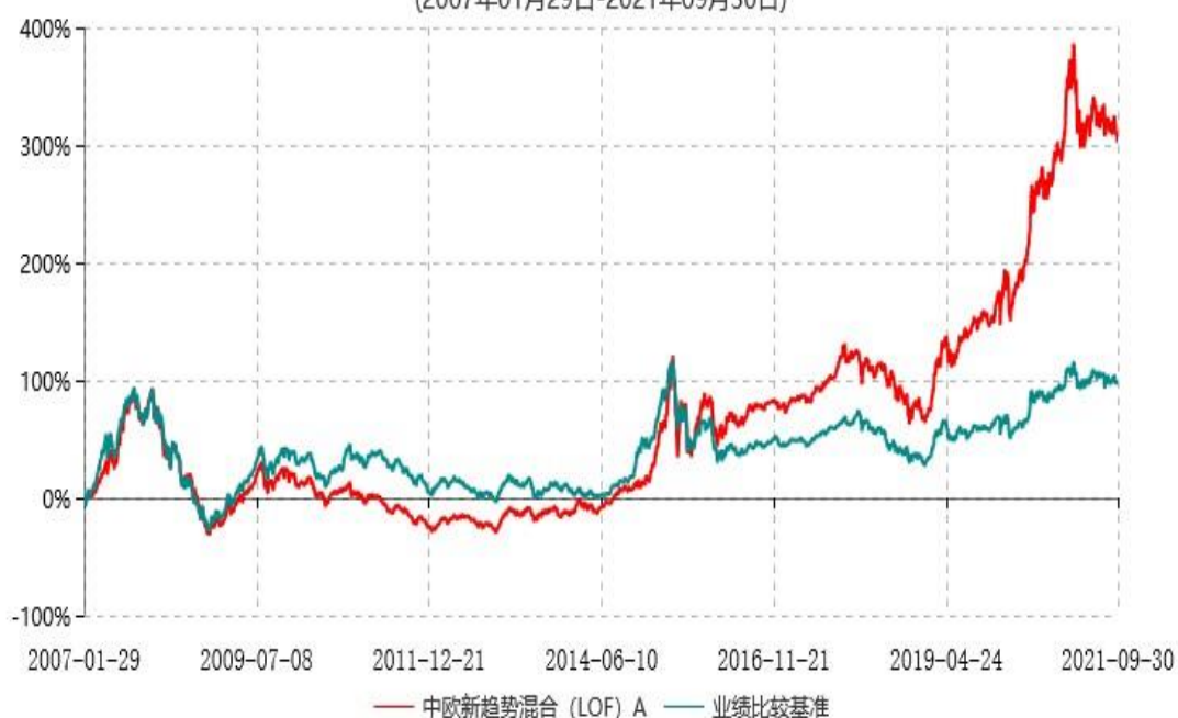
中欧新趋势混合（LOF）A累计净值增长率与业绩比较基准收益率历史走势对比图 (2007年01月29日-2021年09月30日)