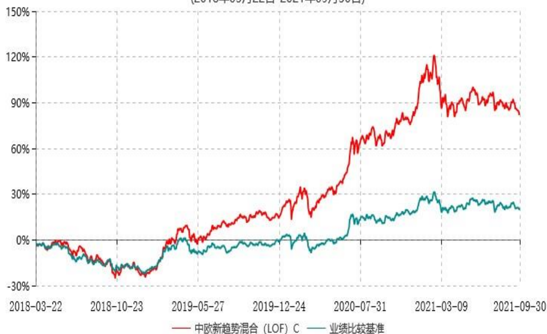
中欧新趋势混合（LOF）C 累计净值增长率与业绩比较基准收益率历史走势对比图 (2018年03月22日-2021年09月30日)

注：本基金于 2018 年 3 月 21 日新增 C 类份额，图示日期为 2018 年 3 月 22 日至 2021 年 09 月 30 日。