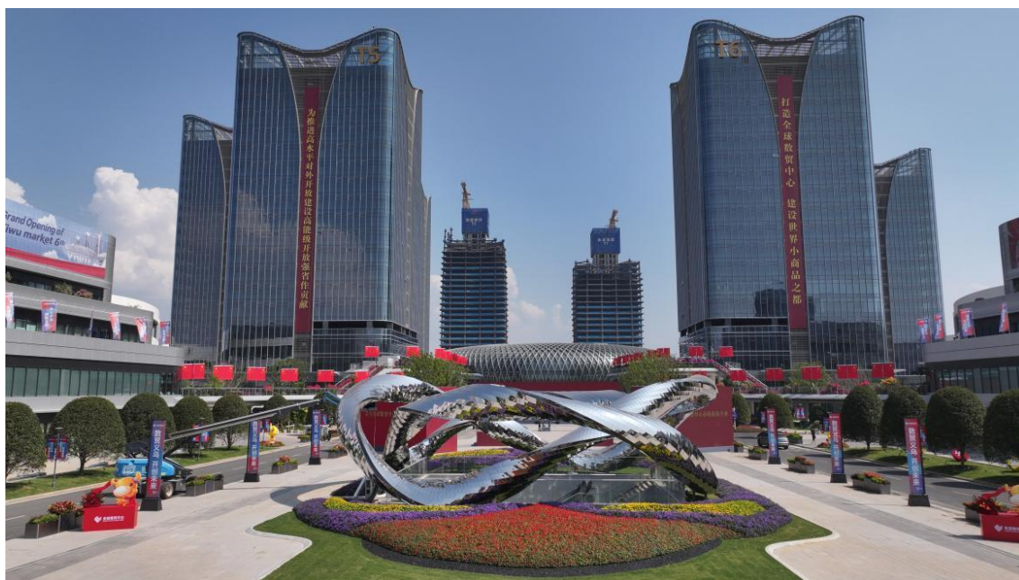
（图2 义乌第六代市场标志项目——全球数贸中心）

作为第六代市场的标杆载体，全球数贸中心并非传统批发市场形态的简单延伸和升级，其创新采用现代化“街巷式”空间设计，涵盖无人机及无人化装备、时尚珠宝、创意潮流玩具、护肤及医美用品等行业，垂直布局时尚消费、母婴消费、悦己消费、情绪消费等高成长性细分领域，产业集聚效应显著。截至2025年底，全球数贸中心省外经营主体占比超40%，商二代、创二代等新生代经营者占比达52%，拥有自主品牌或经营IP产品的商户占比57%，进一步夯实了产业集聚优势。同时，全球数贸中心积极投入AI导航导购、机器人巡检等数字化设施，聚焦数字化贸易核心需求，为全球中小商户提供全新范式与解决方案，助力引领整个义乌市场成为新一代数字贸易枢纽，充分彰显了“义乌速度、义乌创造、义乌活力、义乌信心”。