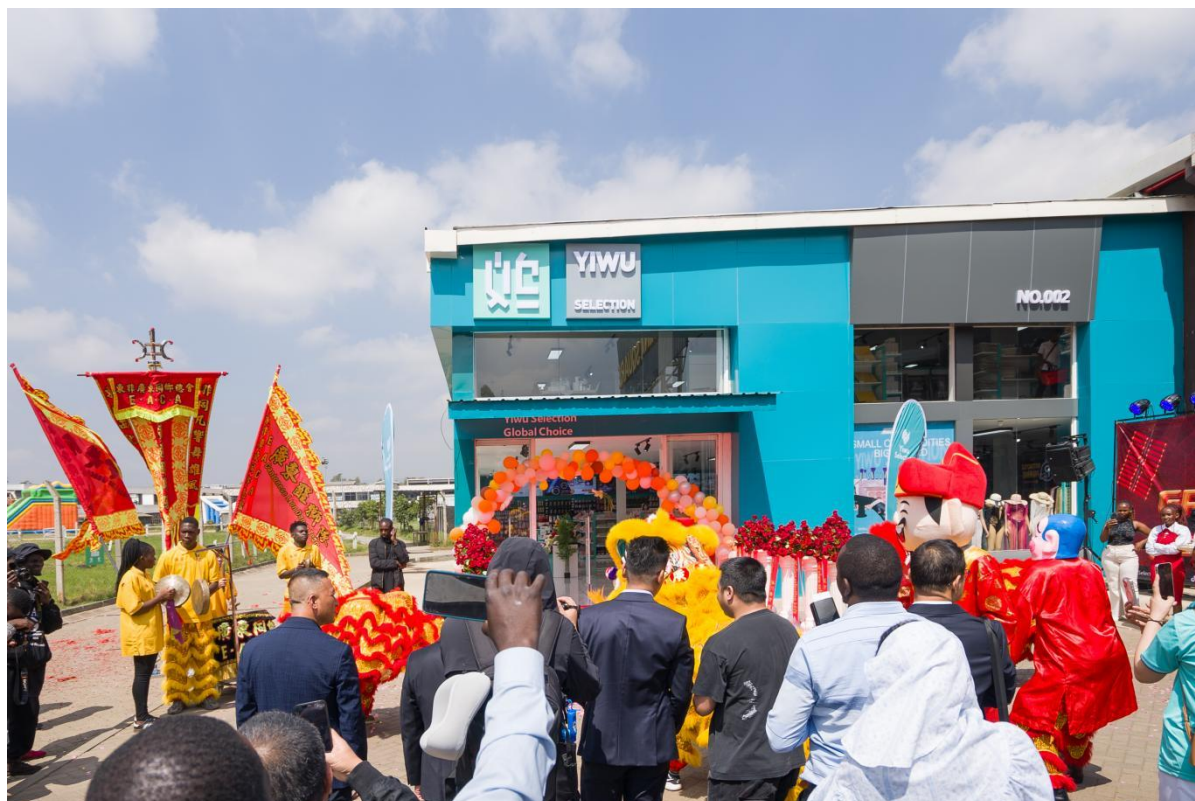
（图 7 肯尼亚海外展厅开业）

截至 2025 年底，“小商品城品牌出海”计划已累计在全球 36 个国家和地区布局 78 个出海项目，其中 2025 年新增 32 个，包括日本大阪、吉尔吉斯斯坦比什凯克、安哥拉罗安达、澳大利亚墨尔本等 4 个海外分市场，美国芝加哥、尼日利亚拉各斯等 13 个自营及合作海外仓，肯尼亚、意大利等 8 个海外展厅，韩国、印尼等 6 场 Yiwu Fair 海外展，以及肯尼亚 1 个海外国家站，形成覆盖全球的贸易服务网络。自“品牌出海”计划发布以来，已帮助 5000 余家经营主体出海开拓海外市场，带动义乌市场年出口 130 亿元以上。