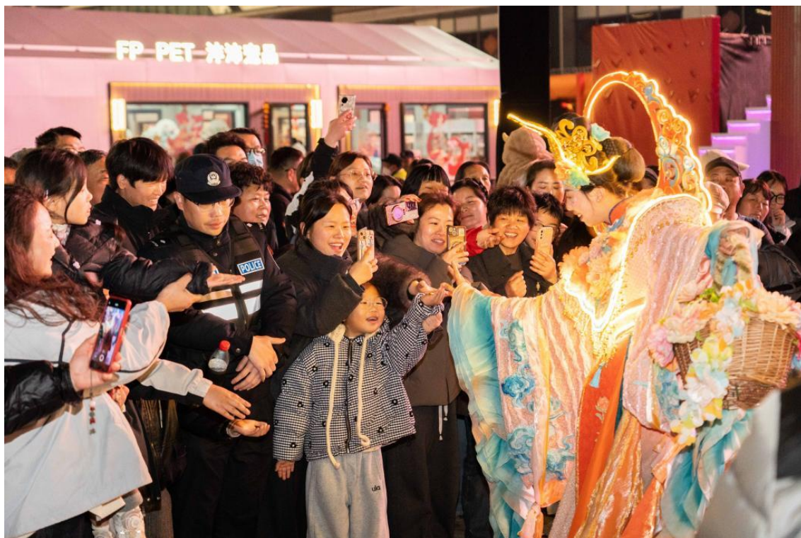
（图1 “嗨购全球·打卡春晚”义乌小商品城2026年游园大集）

5.品牌影响力跨越提升。 2026年总台春晚义乌分会场主舞台在全球数贸中心惊艳亮相，“有情有义 世界义乌”品牌形象火遍全网，向全球逾12亿人次展示了开放包容的姿态，带动义乌文旅市场强势增长。春节期间，义乌市全域旅游人数431.07万人次，同比增长37.22%；全域旅游综合收入38.8亿元，同比增长34.62%。正月初三到十三，举办“嗨购全球·打卡春晚”系列活动，首日三个市场打卡点位总客流超6.1万人次，其中全球数贸中心主舞台客流超4.2万人次。截至正月初七，全域春晚打卡点累计客流突破130万人次。