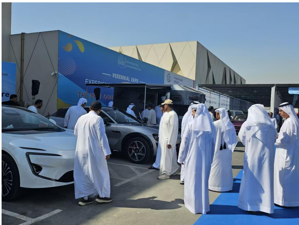
(图8 首届“中国汽车节”在迪拜义乌市场举行)