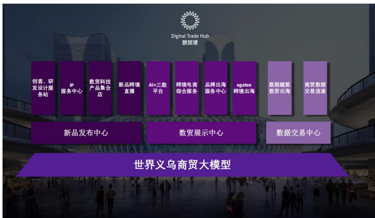
（图 9 数贸港总体框架）

义乌全球数贸中心数贸港将建设数贸展示、数据交易、新品发布三个中心，以“世界义乌”商贸大模型与可信数据空间技术为底座，深度联动 Chinagoods、智捷元港、义支付三大数字化平台，统筹布局十大特色应用场景，构建全链路、一体化的数智贸易服务体系。