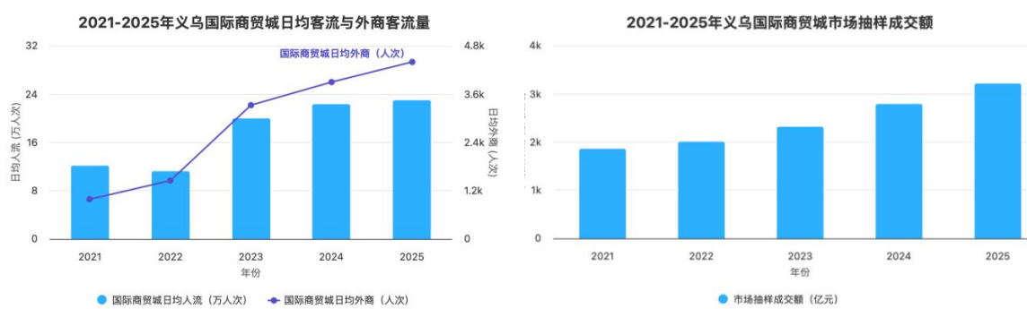
(图 3-4 2021—2025 年义乌市场客流量及成交额趋势)

109万人；顺利举办第8届“商城杯”创意设计大赛，累计对接全球院校超470所，征集作品数量持续增长。搭建“创客空间”新产品开发平台，截至2025年底，已成功连接创客300位，服务经营户开发了500款原创设计产品，为市场注入源源不断的创新活力。同时，公司积极推进标准化建设，制定并发布《宠物猫狗用窝（垫）》《化妆品用玻璃包装材料》等团体标准7项，累计36项，鼓励小商品标准应用，年内累计新增用标商品39000个。截至2025年底，64.13%的市场商户在商品创新设计上有投入，超54.83%的商户每月上架新品，约52.38%的商户拥有自己的工厂，约46.01%的商户拥有自有品牌，形成了“创新驱动、品牌引领、标准支撑”的良好发展格局，进一步夯实了义乌市场的核心竞争力。