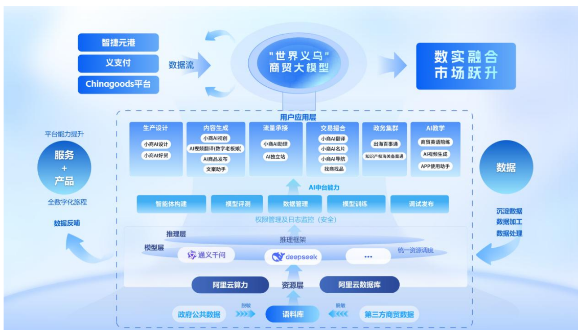
(图5 世界义乌商贸大模型)

截至2025年底，世界义乌大模型APP注册用户超5.6万人，累计调用量突破10亿次，深度使用者订单增幅超30%；AI系列产品服务用户超28.8万人，惠及市场商户超3.4万家。公司围绕市场贸易主体能力提升，系统开展AI训练营、智汇讲堂等精准培训项目，2025年累计组织培训超450场，覆盖学员近15万人次，有效提升市场主体AI应用意识与实操能力。