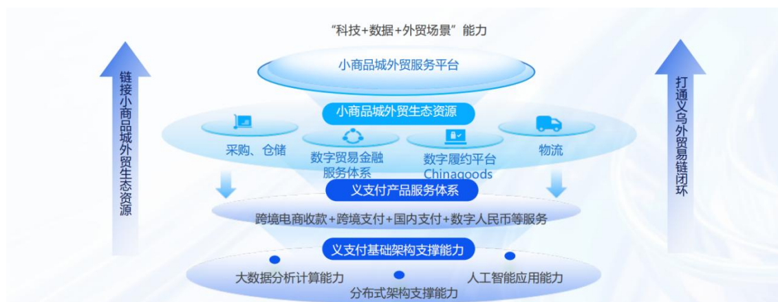
(图6 义支付深度赋能专业市场外贸企业用户)

公司深度挖掘金融赋能场景，保理业务优化产品研发与系统建设，全年新增放款 5.69 亿元，切实缓解中小微商户资金压力；征信业务加大信用数据产品研发与推广力度，构建覆盖商品贸易全链路的数字金融生态，为市场主体提供多元化金融支撑，助力实体经济发展。