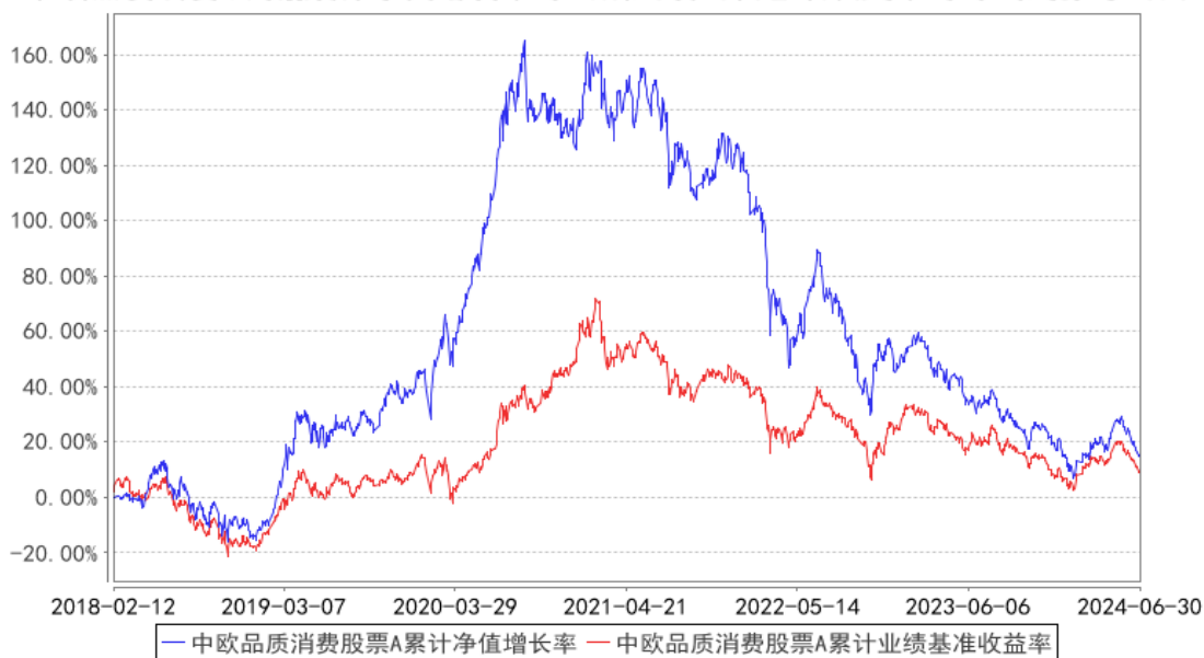
中欧品质消费股票A累计净值增长率与同期业绩比较基准收益率的历史走势对比图