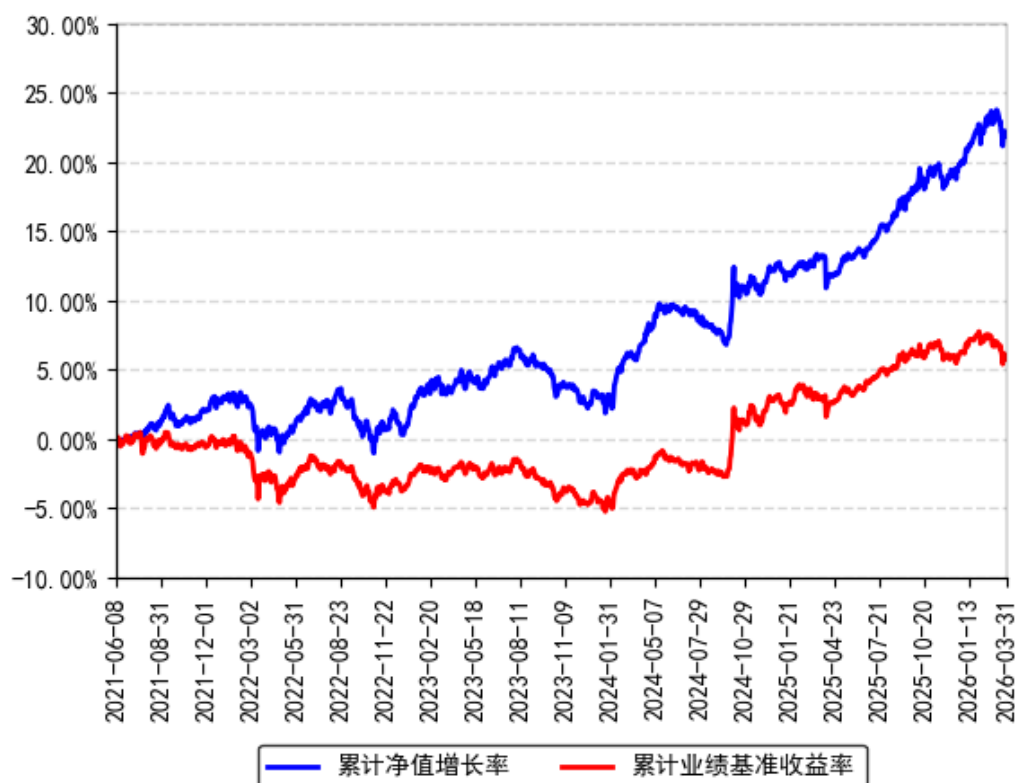
南方宝恒混合A累计净值增长率与同期业绩比较基准收益率的历史走势对比图