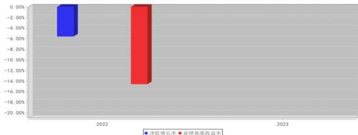
大成聚优成长混合C基金每年净值增长率与同期业绩比较基准收益率的对比图（2023年12月31日）