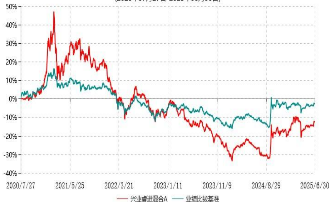
兴业睿进混合C累计净值增长率与业绩比较基准收益率历史走势对比图