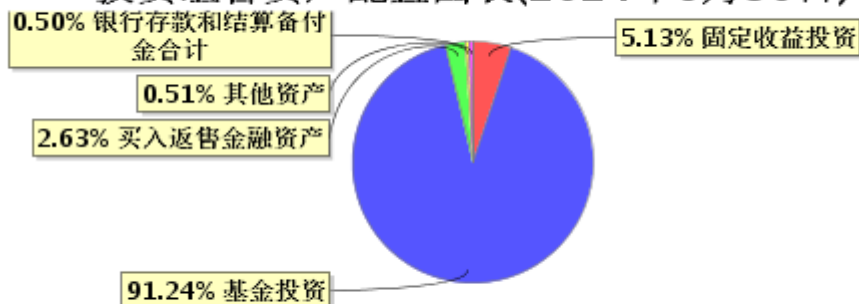
投资组合资产配置图表(2024年6月30日)

● 固定收益投资 ● 基金投资 ● 买入返售金融资产 ● 其他资产 ● 银行存款和结算备付金合计