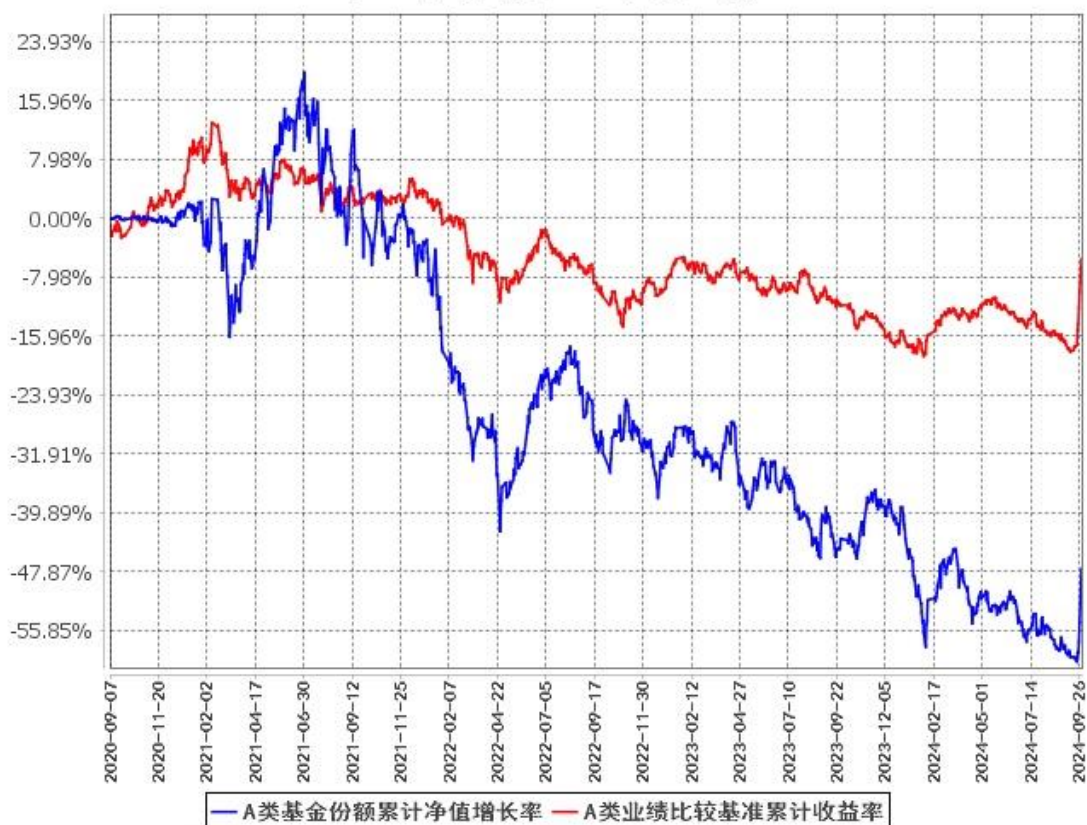
A类基金份额累计净值增长率与同期业绩比较基准收益率的历史走势对比图 (2020年9月7日至2024年9月30日)