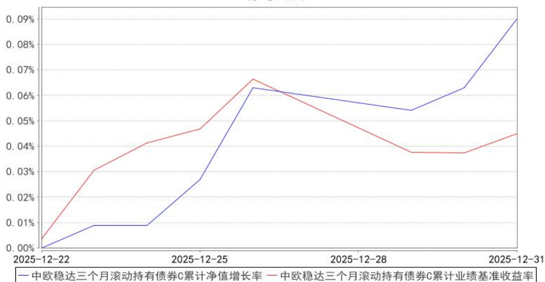
中欧稳达三个月滚动持有债券C累计净值增长率与同期业绩比较基准收益率的历史走势对比图

注：本基金基金合同生效日期为 2025 年 12 月 22 日，自基金合同生效日起到本报告期末不满一年，按基金合同的规定，本基金自基金合同生效起六个月为建仓期，建仓期结束时各项资产配置比例应当符合基金合同约定。