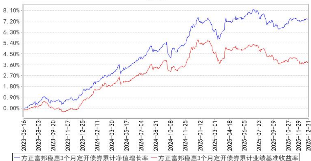
方正富邦稳惠3个月定开债券累计净值增长率与同期业绩比较基准收益率的历史走势对比图