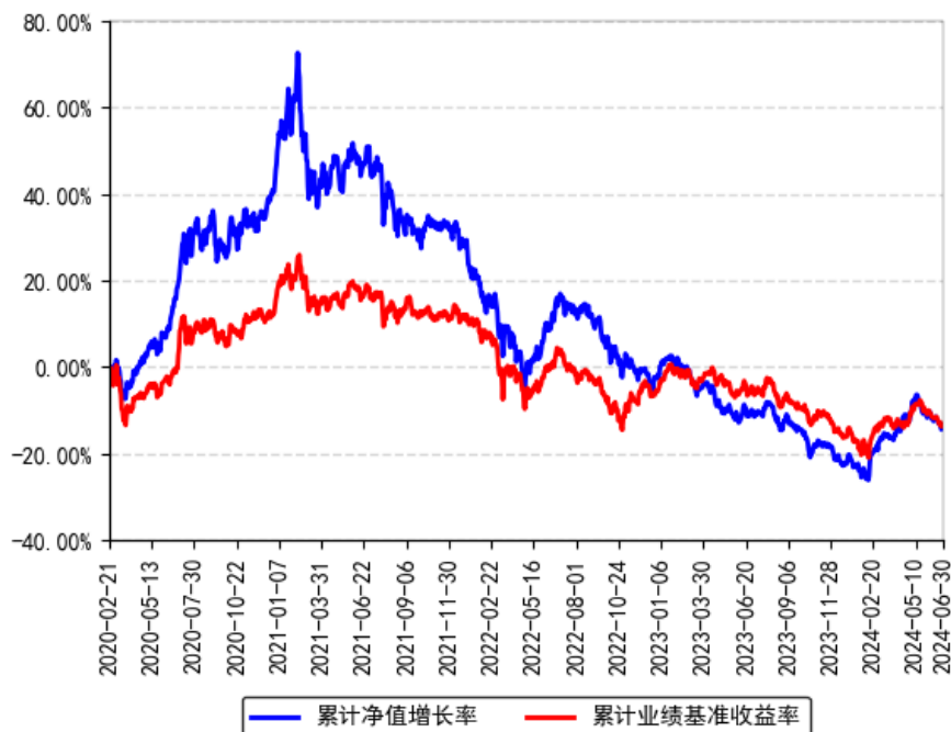
南方内需增长两年持有期股票A累计净值增长率与同期业绩比较基准收益率的历史走势对比图