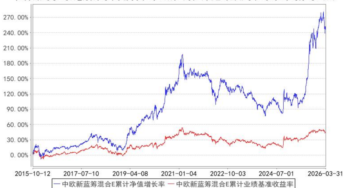
中欧新蓝筹混合E累计净值增长率与同期业绩比较基准收益率的历史走势对比图

注：本基金于 2015 年 10 月 8 日新增 E 类份额，图示日期为 2015 年 10 月 12 日至 2026 年 03 月 31 日。