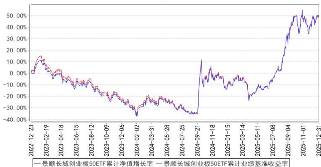
景顺长城创业板50ETF累计净值增长率与同期业绩比较基准收益率的历史走势对比图

注：基金的投资组合比例为：基金投资于标的指数成份股及备选成份股的资产不低于基金资产净值的90%，且不低于非现金基金资产的80%，因法律法规的规定而受限制的情形除外。本基金每个交易日日终在扣除股指期货合约、股票期权合约需缴纳的交易保证金后，应当保持不低于交易