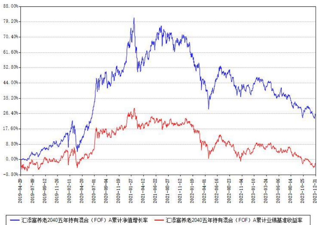
汇添富养老2040五年持有混合 (FOF) Y累计净值增长率与同期业绩基准收益率对比图