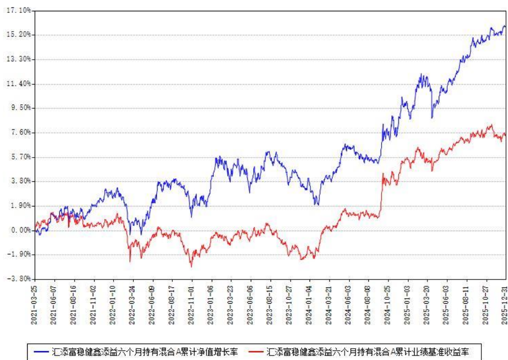
汇添富稳健鑫添益六个月持有混合A累计净值增长率与同期业绩基准收益率对比图