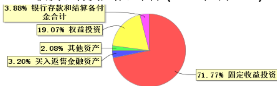
投资组合资产配置图表(2026年3月31日)

● 固定收益投资 ● 买入返售金融资产 ● 其他资产 ● 权益投资 ● 银行存款和结算备付金合计