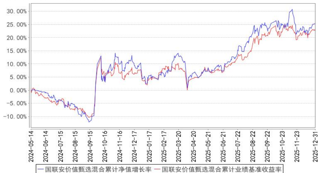
国联安价值甄选混合累计净值增长率与同期业绩比较基准收益率的历史走势对比图

注：1、本基金业绩比较基准为沪深 300 指数收益率*70%+中债综合指数收益率*20%+恒生指数收益率*10%；