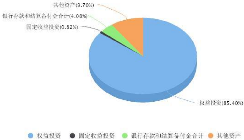
投资组合资产配置图表 数据截止日期:2024年09月30日