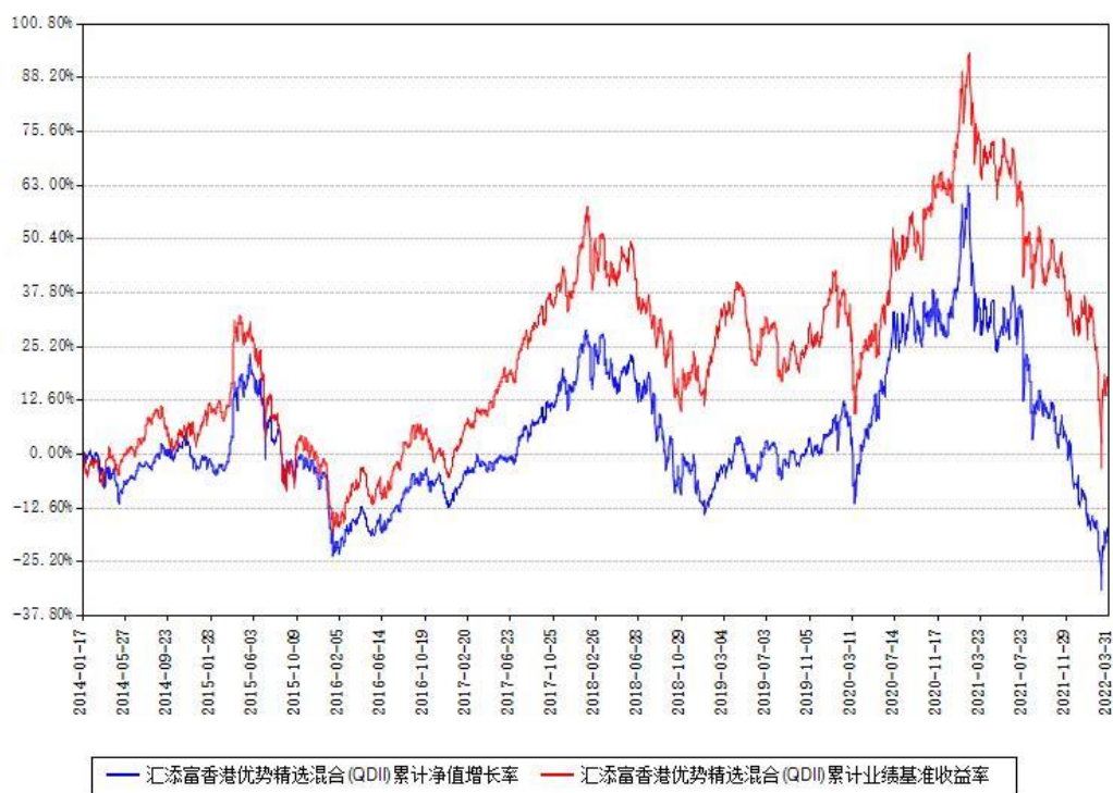
汇添富香港优势精选混合(QDII)累计净值增长率与同期业绩基准收益率对比图