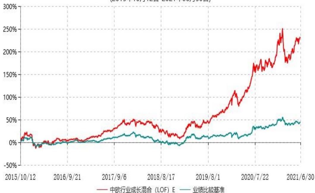
中欧行业成长混合 (LOF) E 累计净值增长率与业绩比较基准收益率历史走势对比图 (2015年10月12日-2021年06月30日)

注：本基金自 2015 年 10 月 8 日新增 E 类份额，图示日期为 2015 年 10 月 12 日至 2021 年 06 月 30 日。