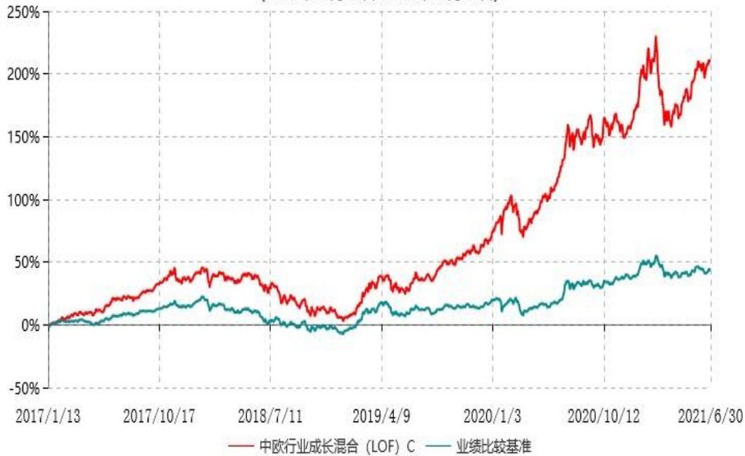
中欧行业成长混合 (LOF) C 累计净值增长率与业绩比较基准收益率历史走势对比图 (2017年01月13日-2021年06月30日)

注：本基金自 2017 年 1 月 12 日起新增 C 类份额，图示日期为 2017 年 1 月 13 日至 2021 年 06 月 30 日。