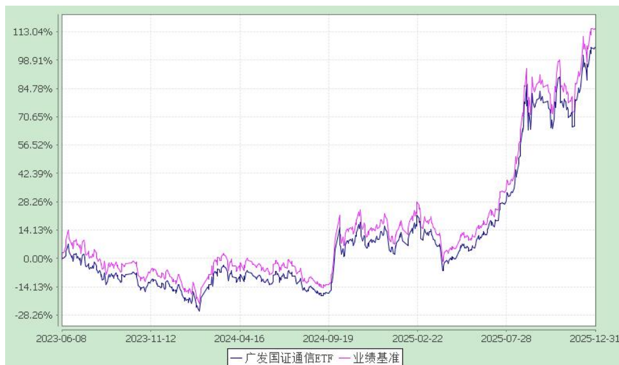
广发国证通信交易型开放式指数证券投资基金 份额累计净值增长率与业绩比较基准收益率的历史走势对比图 (2023 年 6 月 8 日至 2025 年 12 月 31 日)