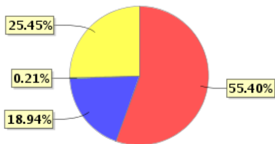
投资组合资产配置图表(2023年9月30日)

● 固定收益投资 ● 买入返售金融资产 ● 其他资产 ● 银行存款和结算备付金合计