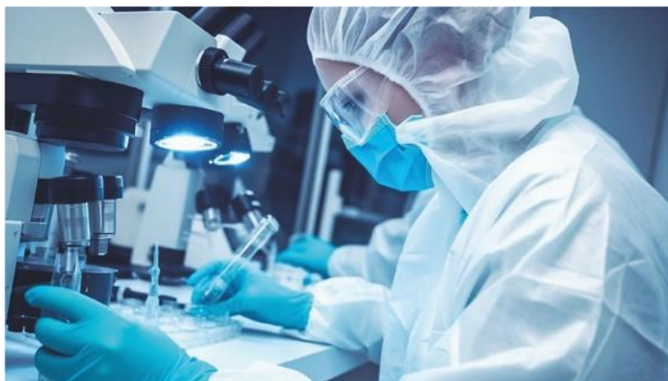
图 11 公司丁腈手套、口罩、防护服等产品应用场景图

经营情况： ① 拓展海外市场，提升品牌影响力。 公司产品新进入 100 家海外工业防护用品渠道商，丁腈手套销量 13.6 亿只，同比增长 267%，提升了公司的品牌影响力。② 技术驱动创新，开发差异化产品。 公司研发的超柔软丁腈手套、超薄丁腈手套、高等级防化手套等创新产品，为行业提供了新的防护解决方案。