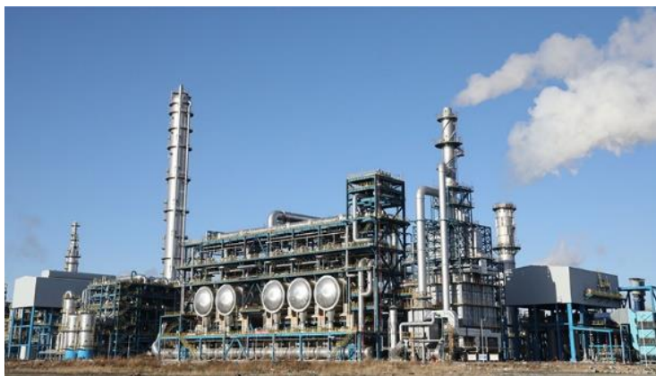
图 7 辽宁金发厂区

经营情况： ① 聚焦提质增效，提升装置运行水平。 公司完成了首期技改技措项目，各装置能耗、单耗同比下降，副产物得到有效利用，单位加工费用大幅降低。② 提升专用料产销比例，积极开拓高端市场。 公司以“差异化”为市场策略，专用产品占比持续提高，电镀材料、冰箱板材等市场领域逐步打开。同时，公司积极拓展海外市场，海外销量和境外客户数量均有增长。③ 优化管理，提升效率。 公司通过优化组织架构，实施精细化考核管理，提升了内部运营效率，有效降低了运营成本。