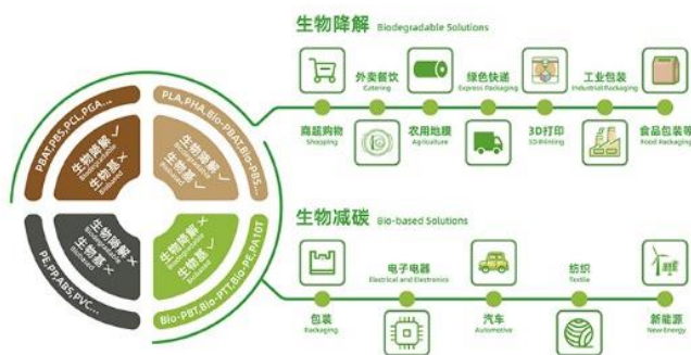
图 8 公司完全生物降解塑料、生物基材料的应用领域图

经营情况：①开发新产品、拓展新应用。 公司研发的生物基 PBT、高白度高强度 PBS、全生物基生物降解膜袋专用料等多种新产品，丰富了公司功能性聚酯的产品种类，拓宽了生物塑料在中高端工业领域的应用范围，满足了市场多元化需求，提升了公司在全行业的核心技术竞争力。 ②建设合成生物技术研发平台，助力产业链延伸。 公司加快布局生物基单体及生物基材料技术研究，着力打造合成生物技术研发能力，稳步推进生物基单体产业化建设及生物基聚酯产业化建设，加速产业链上下游一体化协同发展。公司“基于分子链软硬段精准调控的可降解共聚酯制备关键技术及农膜应用”项目荣获 2023 年度国家科技进步奖二等奖。