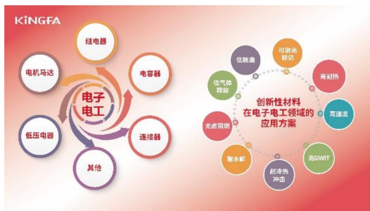
图 4 公司电子电工材料应用场景图

经营情况： ① 突破技术瓶颈，升级产品性能。 公司研发的具有更高长期使用温度的高温 PA，LCP 等改性特种工程材料，满足了行业对高电流、高电压和高温升的要求，广泛应用于连接器、光伏、锂电等行业。② 创新绿色产品，落实低碳战略。 公司研发的化学回收 PBT 材料和生物基 PA，PBT 材料，有效降低了产品碳排放，助力客户的绿色可持续发展战略。