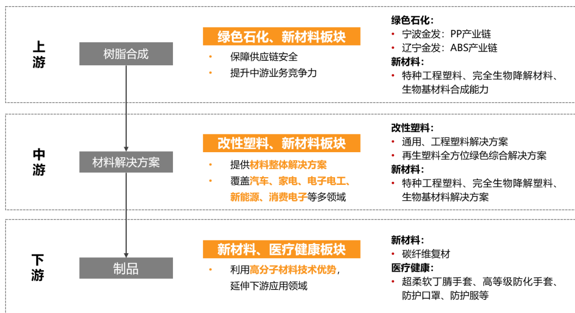
图 2 公司四大板块及主要产品关系图