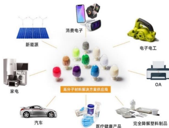
图 1 公司主要产品及应用

金发科技的主营业务为化工新材料的研发、生产和销售，主要产品包括改性塑料、环保高性能再生塑料、完全生物降解塑料、特种工程塑料、碳纤维及复合材料、轻烃及氢能源、聚丙烯树脂、苯乙烯类树脂和医疗健康高分子材料产品等 9 大类。产品广泛应用于汽车、家电、电子电工、通讯电子、新基建、新能源、现代农业、现代物流、轨道交通、航空航天、高端装备、医疗健康等行业，并与众多国内外知名企业建立了战略合作伙伴关系。