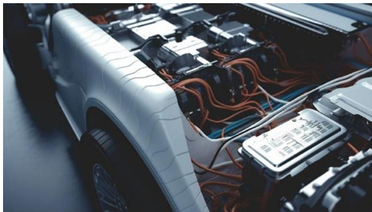
图 5 公司材料在动力电池上的应用场景图

5、消费电子材料： 主要的消费电子材料全球销量 4.79 万吨，同比增长 25.39%。