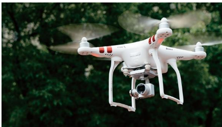
图 10 公司碳纤维及复合材料在无人机上的应用场景图

经营情况： 公司研发的无卤阻燃连续纤维增强热塑性复合材料，解决了新能源汽车电池短路或过热等紧急情况下的安全问题，成功应用于新能源汽车电池盖板，通过了行业头部客户的材料认证。公司研发的连续碳纤维增强热塑性复合材料、连续高强玻璃纤维增强热塑性复合材料，解决了产品良外观、长期耐候、耐热等技术难题，在低空飞行器、光伏、冷链物流车等多个行业应用上实现了高速增长。