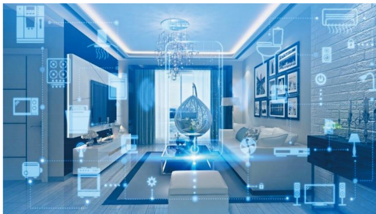
图 3 公司家电材料应用场景图

了家电行业产品低碳设计的需求，在家电零部件上得到批量使用；公司研发的改性聚砜材料，成功应用于家电不粘涂层，丰富了公司产品种类，满足了终端客户多样化、个性化需求。