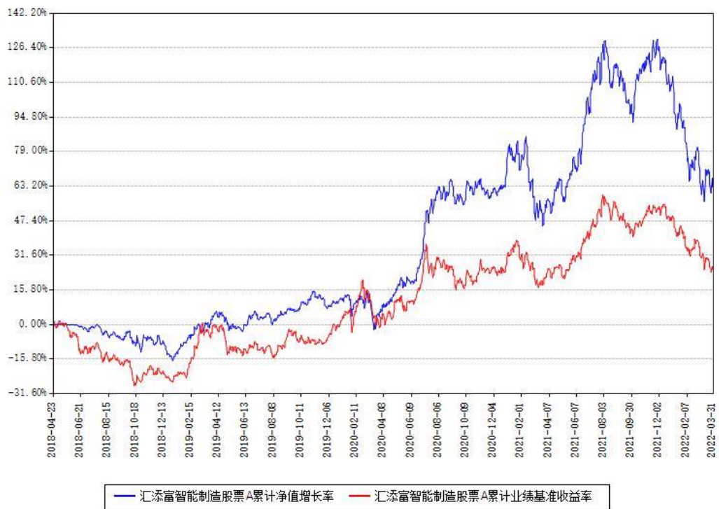
汇添富智能制造股票A累计净值增长率与同期业绩基准收益率对比图