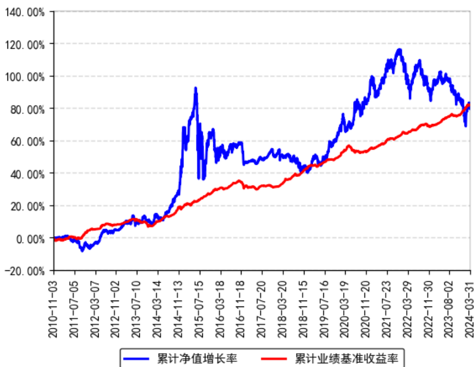
南方广利回报债券A/B累计净值增长率与同期业绩比较基准收益率的历史走势对比图