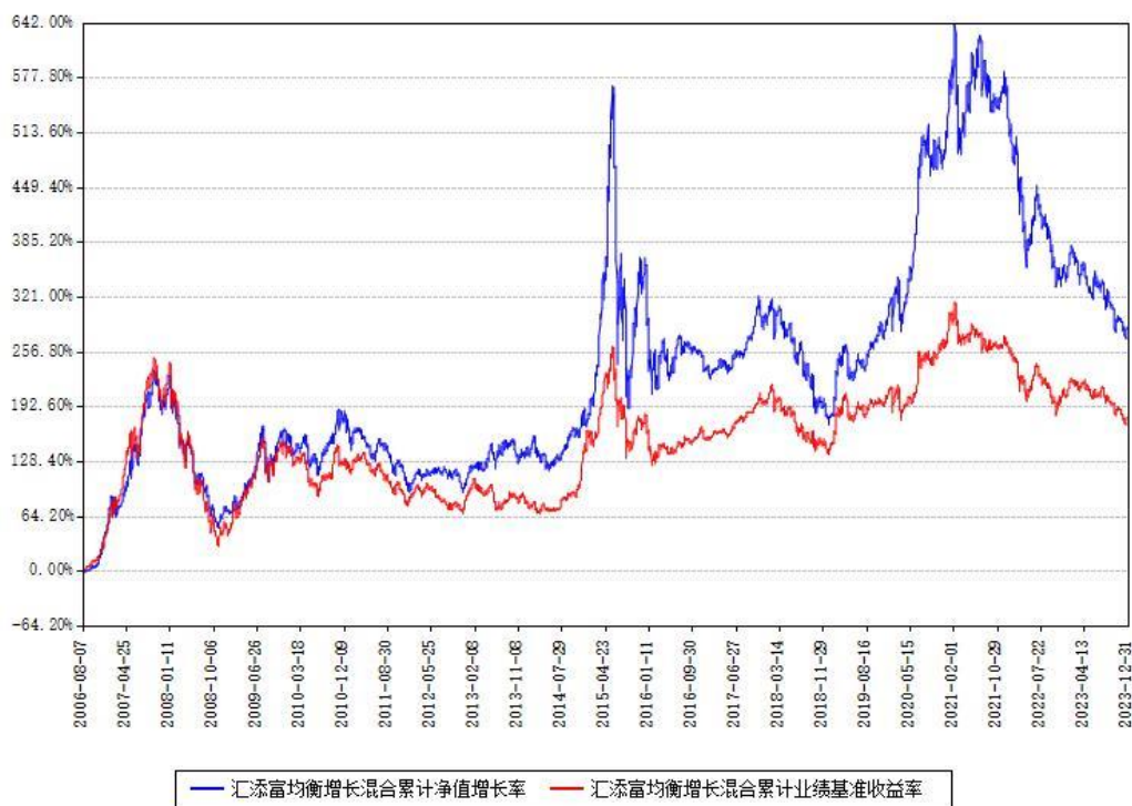
汇添富均衡增长混合累计净值增长率与同期业绩基准收益率对比图

注：本基金建仓期为本《基金合同》生效之日（2006年08月07日）起6个月，建仓期结束时各项资产配置比例符合合同约定。