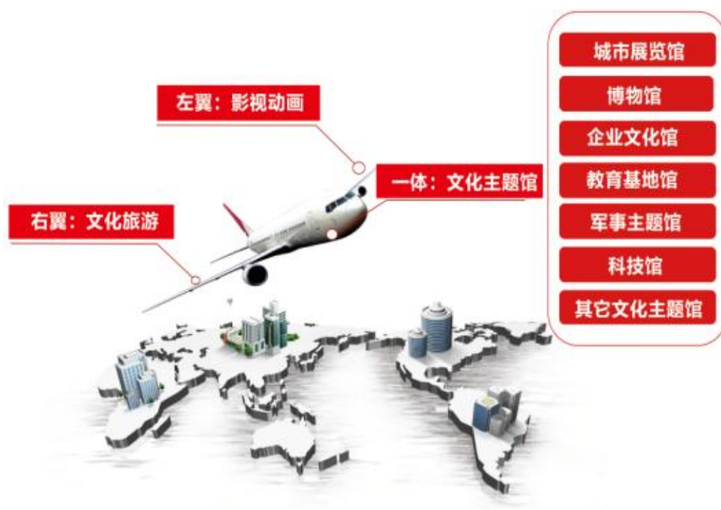
华凯创意“一体两翼”业务格局示意图

公司立足长沙，依托上海桥头堡，不断拓宽大型文化主题展馆空间设计主营业务，同时推动影视动画、文化旅游两翼发展。