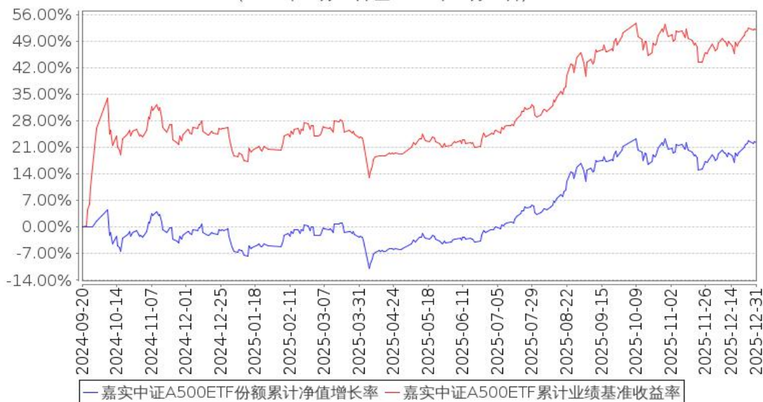
嘉实中证A500ETF份额累计净值增长率与同期业绩比较基准收益率的历史走势对比图 (2024年09月20日至2025年12月31日)

注：按基金合同和招募说明书的约定，本基金自基金合同生效日起6个月为建仓期，建仓期结束