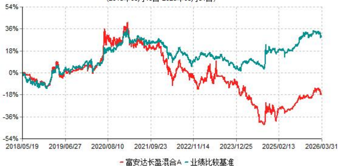
富安达长盈混合A累计净值增长率与业绩比较基准收益率历史走势对比图 (2018年05月19日-2026年03月31日)