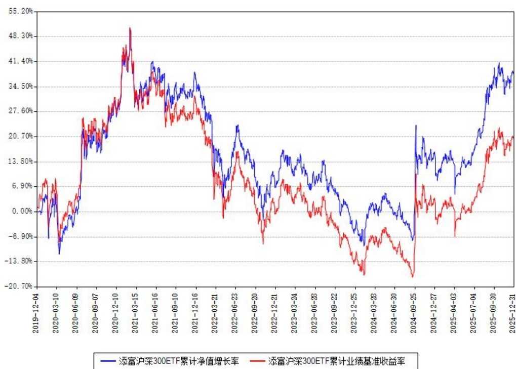
添富沪深300ETF累计净值增长率与同期业绩比较基准收益率对比图

注：本基金建仓期为本《基金合同》生效之日（2019年12月04日）起6个月，建仓期结束时各项资产配置比例符合合同约定。