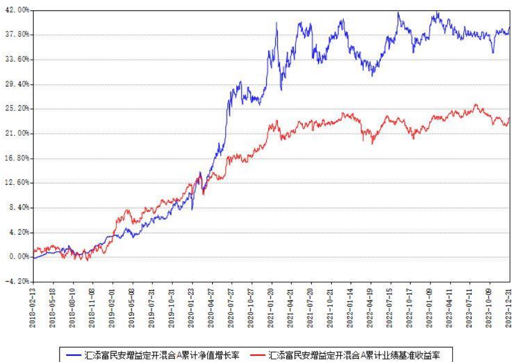
汇添富民安增益定开混合A累计净值增长率与同期业绩基准收益率对比图

(二)自基金合同生效以来基金累计净值增长率变动及其与同期业绩比较基准收益率变动的比较图