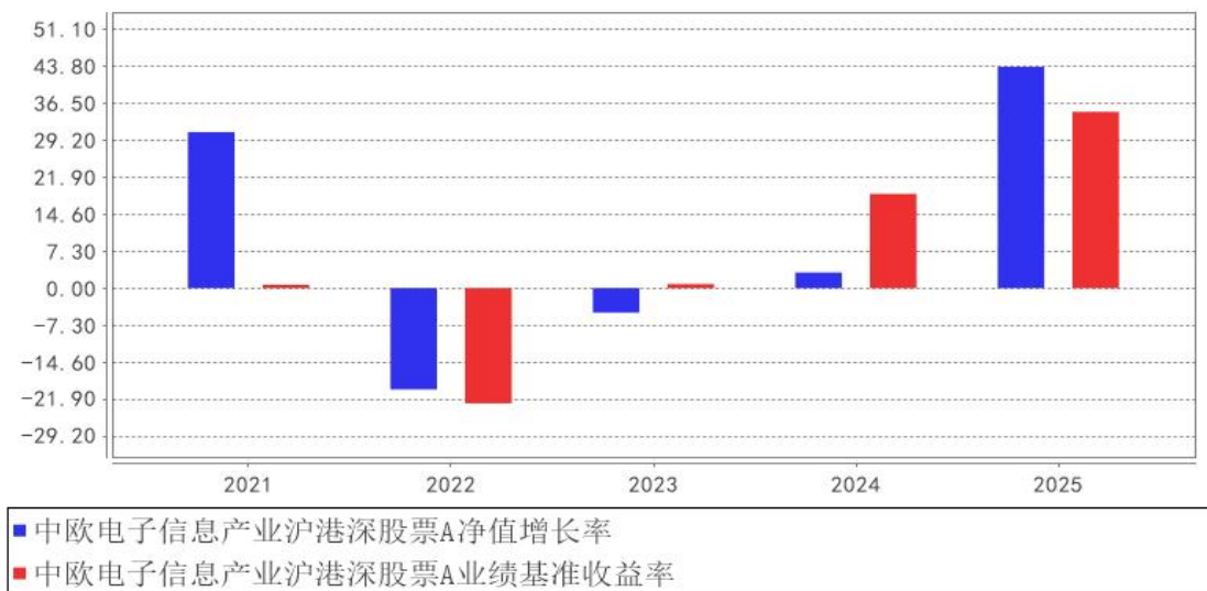
中欧电子信息产业沪港深股票A基金每年净值增长率与同期业绩比较基准收益率的对比图