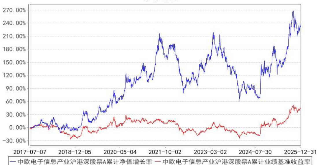
中欧电子信息产业沪港深股票A累计净值增长率与同期业绩比较基准收益率的历史走势对比图