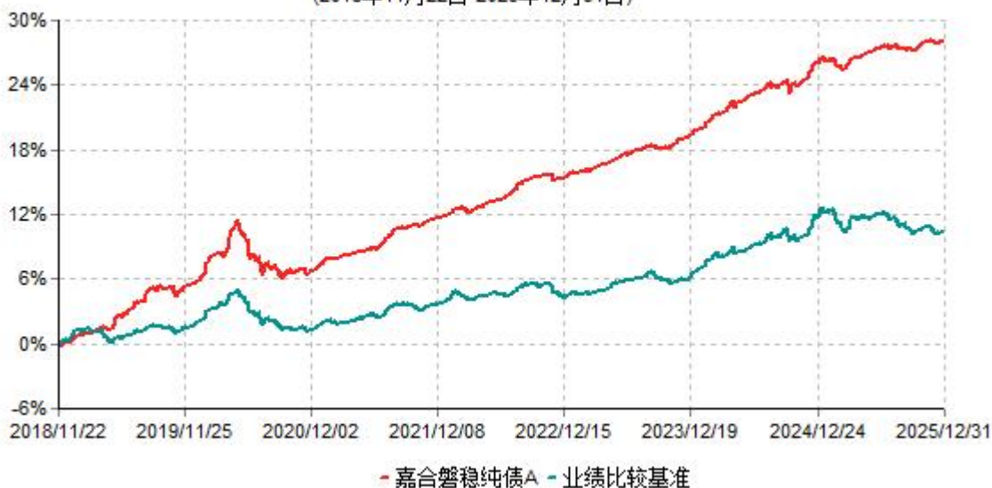
嘉合磐稳纯债A累计净值增长率与业绩比较基准收益率历史走势对比图 (2018年11月22日-2025年12月31日)