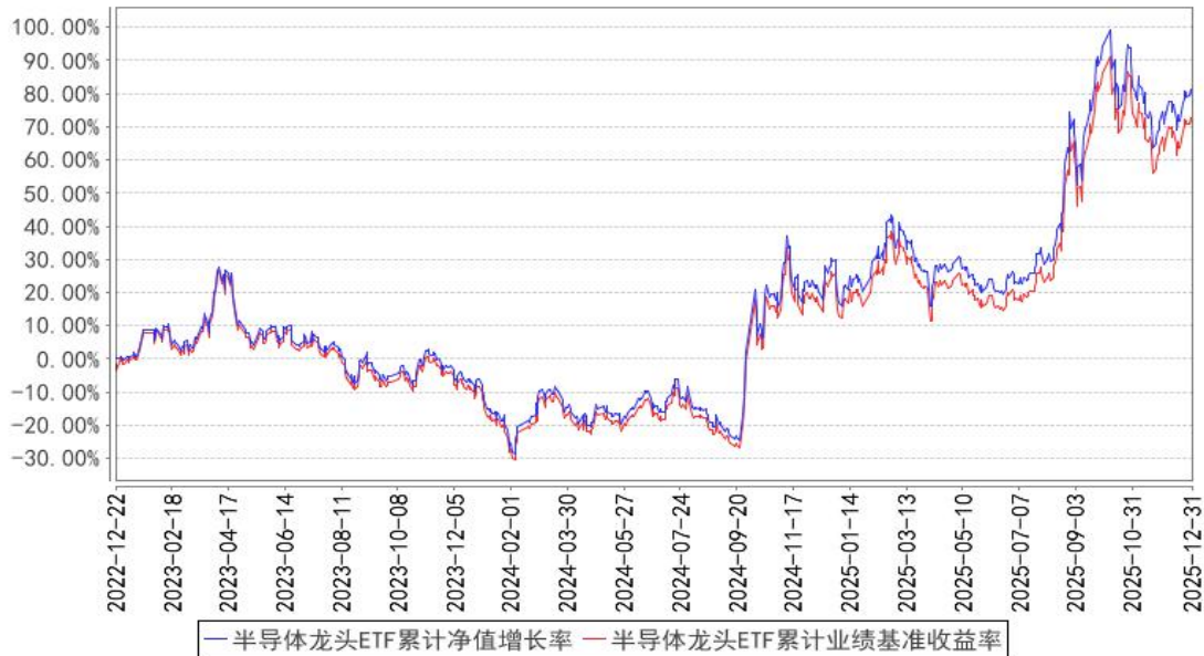
半导体龙头ETF累计净值增长率与同期业绩比较基准收益率的历史走势对比图