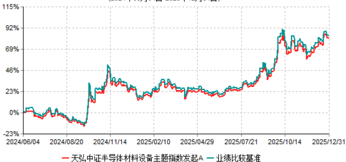
天弘中证半导体材料设备主题指数发起A累计净值增长率与业绩比较基准收益率历史走势对比图 (2024年06月04日-2025年12月31日)