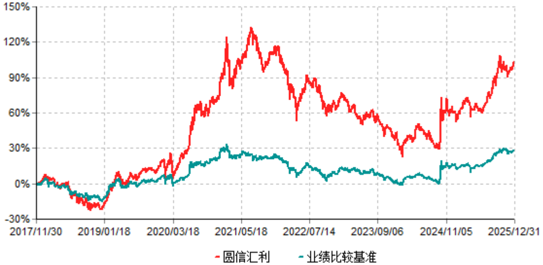
圆信汇利累计净值增长率与业绩比较基准收益率历史走势对比图 (2017年11月30日-2025年12月31日)