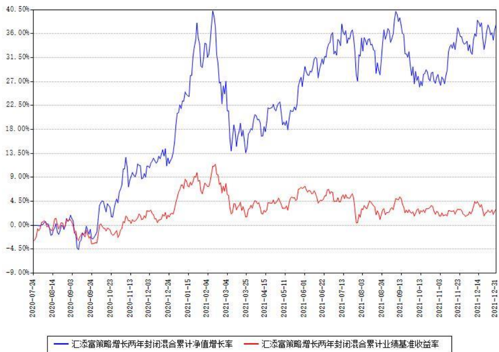
汇添富策略增长两年封闭混合累计净值增长率与同期业绩基准收益率对比图