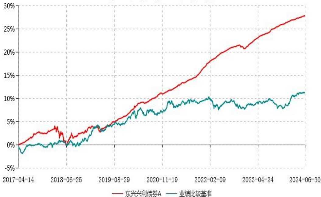
东兴兴利债券C累计净值增长率与业绩比较基准收益率历史走势对比图