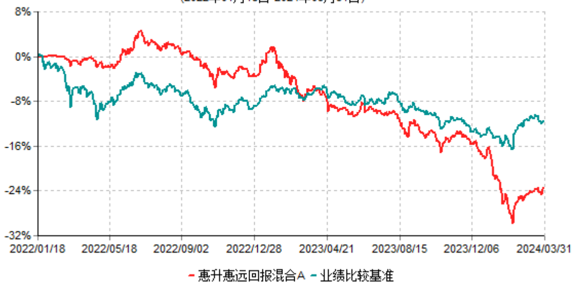
惠升惠远回报混合A累计净值增长率与业绩比较基准收益率历史走势对比图 (2022年01月18日-2024年03月31日)