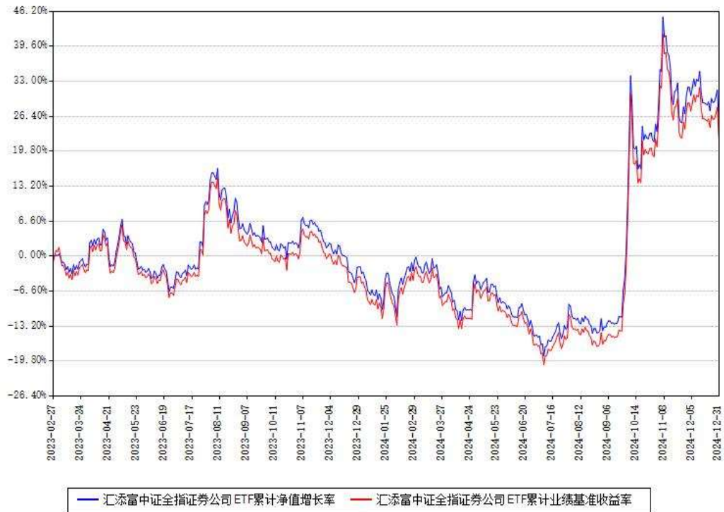
汇添富中证全指证券公司ETF累计净值增长率与同期业绩基准收益率对比图