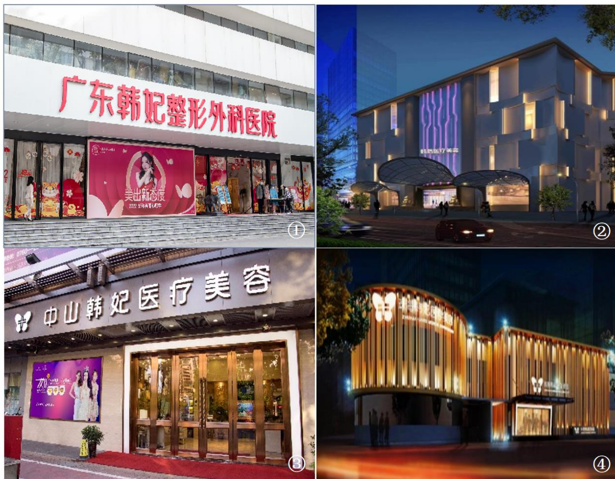
(上图 ①广东韩妃 ②广州韩妃 ③中山韩妃 ④珠海韩妃)

韩妃医美为公司参股企业，目前未达到控股或报表合并的标准，因此，报告期内公司主营业务未发生重大变化。