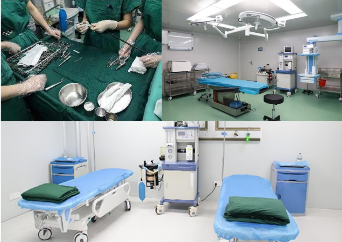
韩妃医美:国家标准手术间+血库+ICU