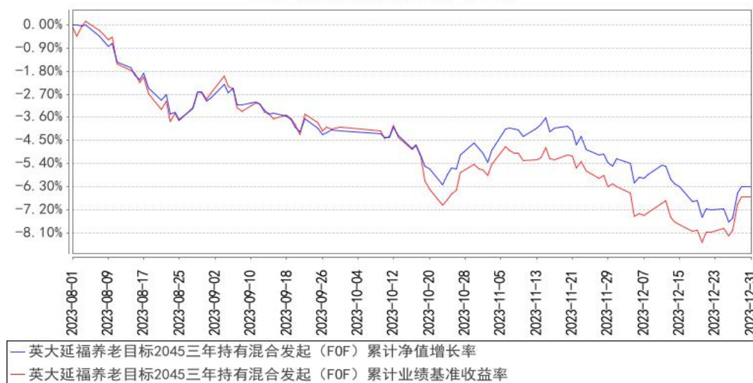
英大延福养老目标2045三年持有混合发起 (FOF) 累计净值增长率与同期业绩比较基准收益率的历史走势对比图

注：1. 同期业绩比较基准为（95%×中证 800 指数收益率+5%×中证港股通综合指数（人民币）收益率）×A%+中债综合全价（总值）指数收益率×（1-A%）。